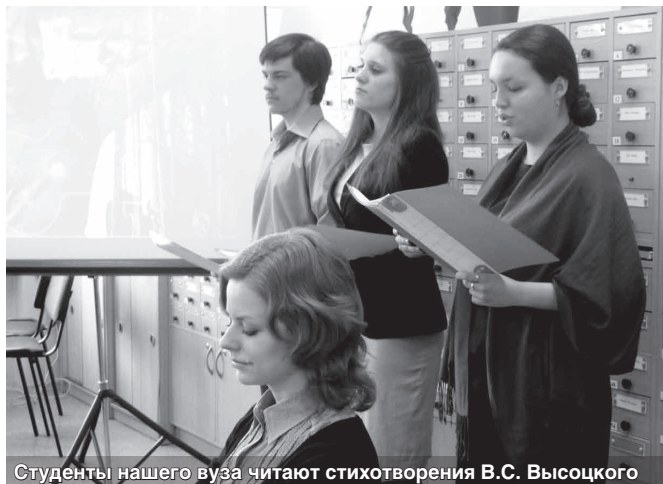
Студенты нашего вуза читают стихотворения В.С. Высоцкого

Литературная встреча, посвященная памяти поэта, музыканта и актера Владимира Высоцкого состоялась в библиотеке НГУЭУ. Студенты нашего университета приняли участие в мероприятии, услышали стихи и песни поэта, узнали, какая любимая театральная роль В. Высоцкого, и как его имя связано с Новосибирском.