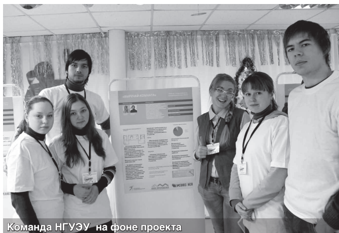
Команда НГУЭУ на фоне проекта