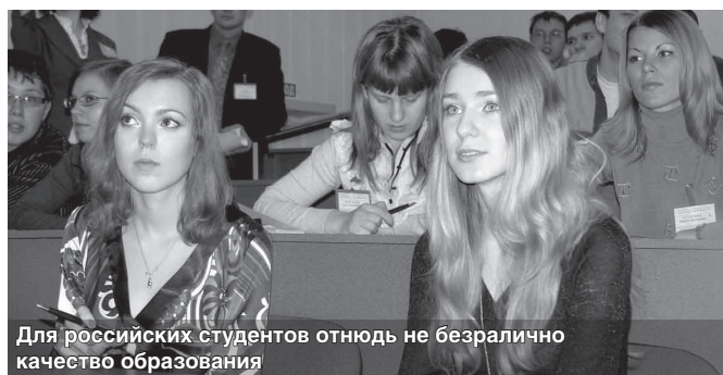
Для российских студентов отнюдь не безразлично качество образования

«Это огромные деньги, и ими нужно правильно распоряжаться. И этому, кстати,