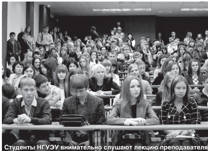
Студенты НГУЭУ внимательно слушают лекцию преподавателя

в психологическом портрете студента появляются мотивированность на профессию, направленность в будущее, интенсивное планирование, самостоятельное построение