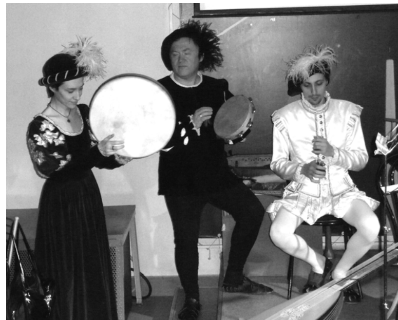
Выступает «Insula Magica»