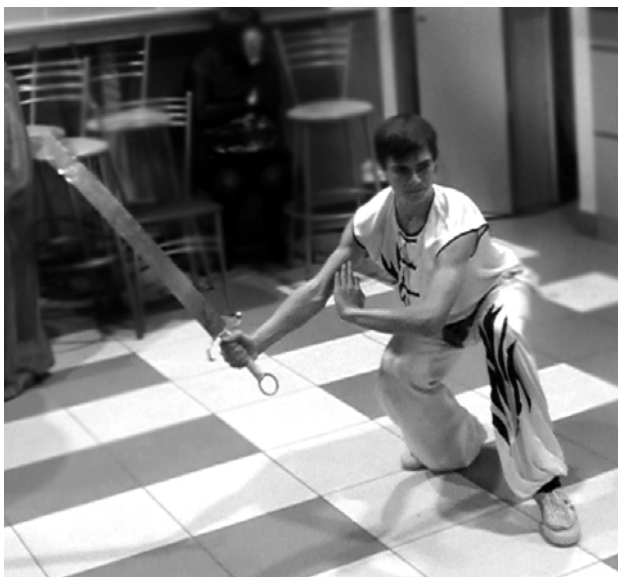
«Душою крепче стали сталь!»

жат головы исследователям и не только. Таким был Леонардо ди сер Пьеро да Винчи – великий итальянский художник (живописец, скульптор, архитектор) и ученый (анатом, математик, физик, естествоиспытатель), яркий представитель типа «универсального человека» – идеала итальянского Ренессанса. Под руководством ведущего Кирилла Харитоновича студенты разгадали кроссворд, составленный на тему работ и изобретений Леонардо. Оказалось, что этот титан Воз-