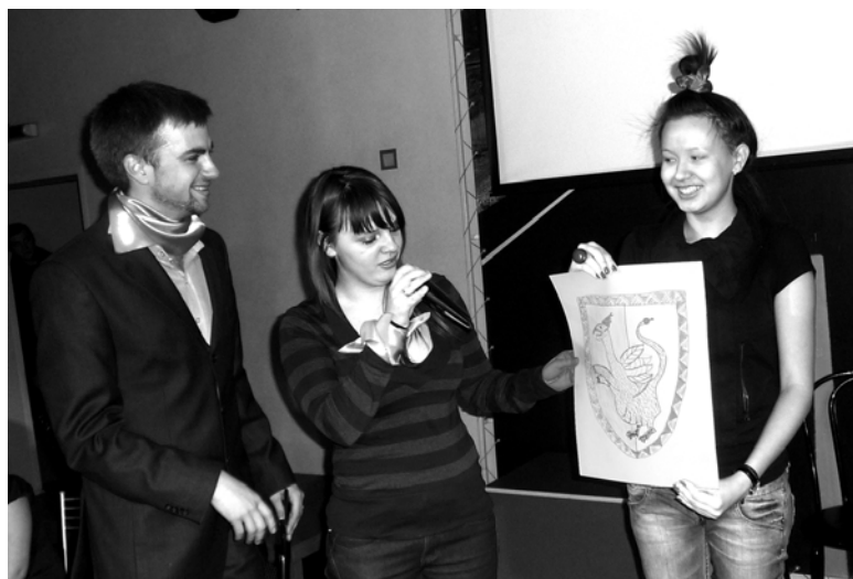
«Расшифровать» герб, нарисованный другим человеком, непросто

рождения был автором даже таких, казалось бы, современных предметов, как велосипед, танк и парашют! А после отгадывания в клетках появилось загадочное слово «сфумато». Именно так в живописи называют смягчение очертаний фигур и предметов, которое позволяет передать окутывающий их воздух. Прием сфумато (итал. sfumato – затухающий, буквально – исчезающий, как дым) разработал опять же не кто иной, как Леонардо да Винчи.