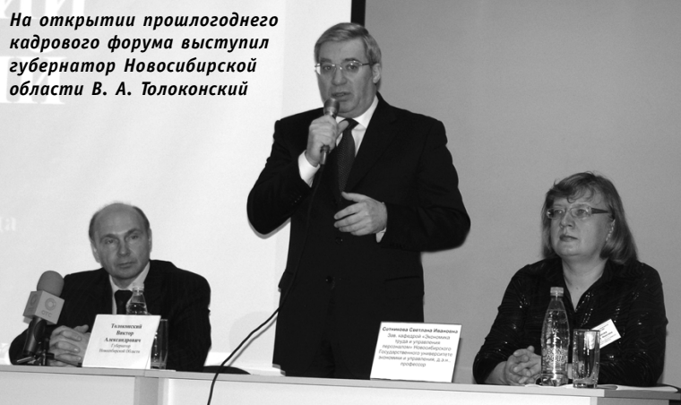
На открытии прошлогоднего кадрового форума выступил губернатор Новосибирской области В. А. Толоконский

Информационно-туристический центр «Экскурсии. Туризм. Отдых в Новосибирской области»