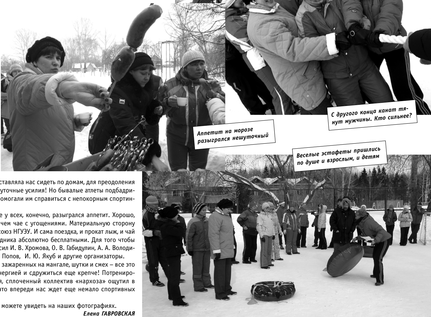
Аппетит на морозе разыгрался нешуточный