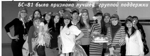
БС-81 была признана лучшей группой поддержки

– Я вообще за любое движение в нашем вузе... Особенно, считаю, турнир был интересен для студентов-парней. Да и преподаватели держались молодцом! С них и берем пример, они успешные как в своих дисциплинах, так и по жизни.