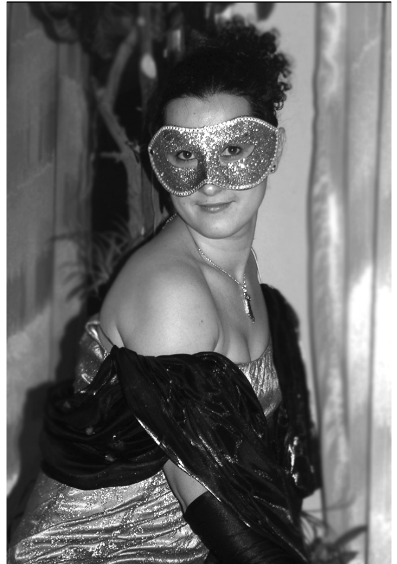
Принц, вы задерживаетесь!