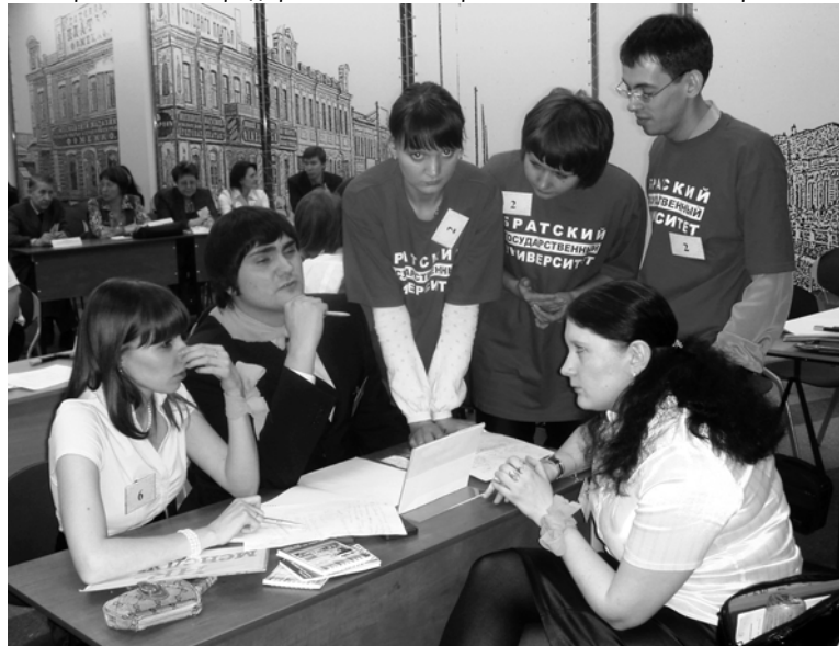
Студенческая олимпиада, проходившая в рамках форума, привлекла команды многих вузов

– А кто стал победителем мероприятий, проводимых в рамках форума?