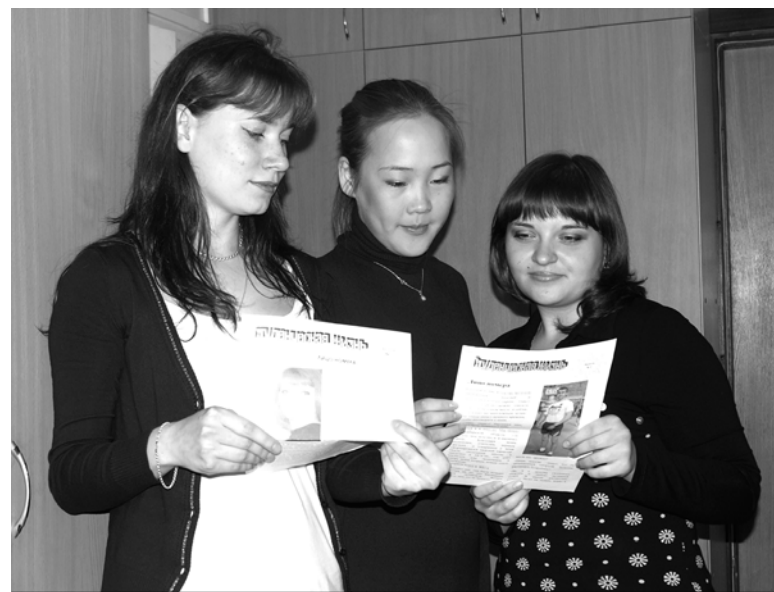
МОЙ НОВОСИБИРСК РОДНОЙ

Ну а что касается конкуренции, то это вещь во всех отношениях полезная. Так что «Наша академия» желает новорожденной «Студенческой жизни» быстрее расти и взрослеть и будет радоваться новым успехам ее «родителей».