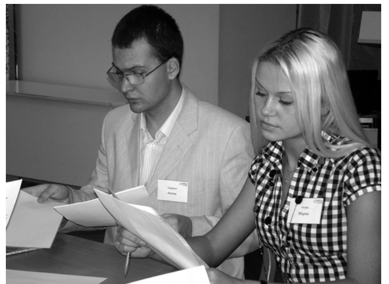
Скоро подобные задачи им предстоит решать в практической работе