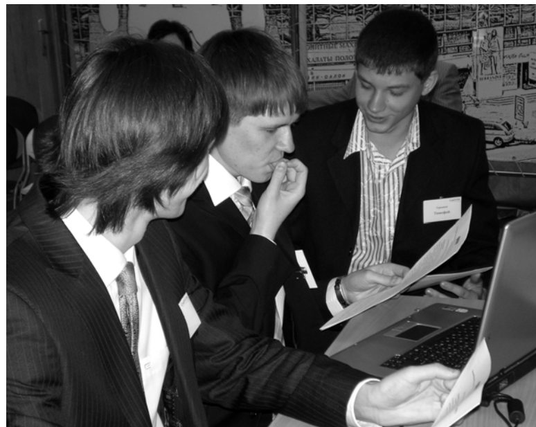
Решение предложенной проблемы потребовало серьезных раздумий

и контактами с представителями бизнес-среды – для этого в «нархозе» собрались студенты экономических специальностей разных вузов города.