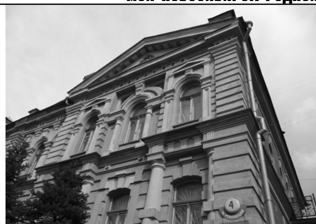
А вы знаете, где стоит такой красивый дом?

ционно-туристический центр «ЭТО», проводя для всех желающих пешеходные исторические экскурсии, в ходе которых можно в суе современного мегаполиса увидеть оскол-