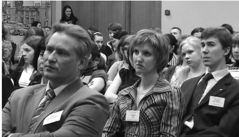
Каждый участник форума почерпнул для себя много полезного и интересного

Мне думается, что проведение форума – это еще один шаг на пути повышения прозрачности, информационной доступности процессов управления персоналом для людей, проявляющих интерес к Сибири и к Новосибирску, где достаточно активно и ус-