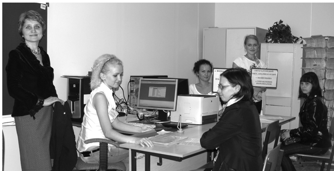
Посетителям здесь всегда рады